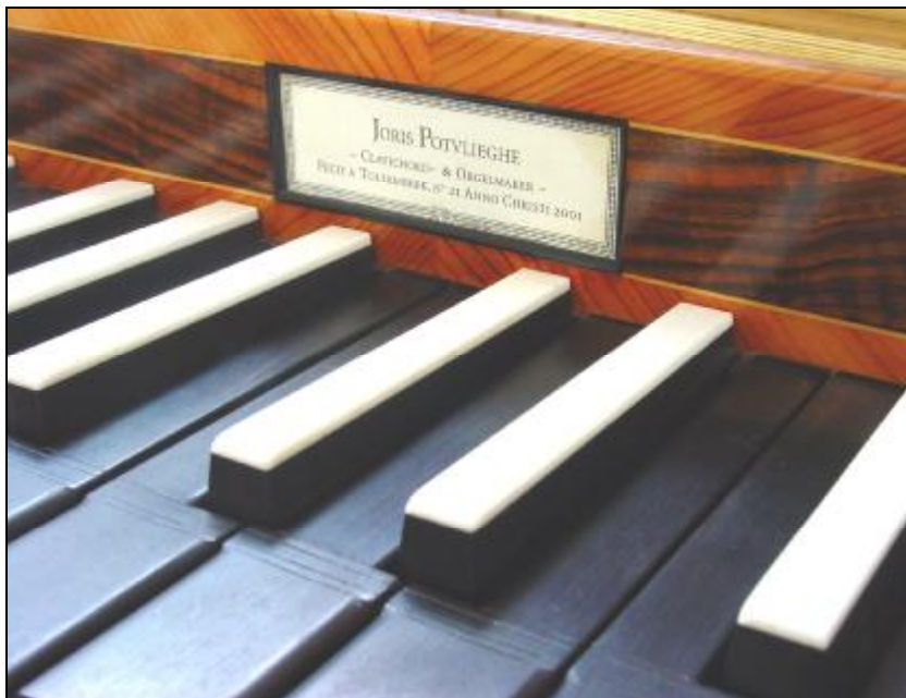
DETAIL SAKSISCH CLAVICHORD 1770 IN NOTENHOUT, ONTWERP JORIS POTVLIEGHE. Een inlegwerk van rechthoekige ramen in wortelnoten hout, afgelijnd met een fijn buxushouten biesje en aan de buitenzijden omkaderd met taxus in ‘visgraat’-motief. Centraal op het naambord wordt een gedrukt naamplaatje ingewerkt en omkaderd met ebbenhout.

In het atelier wordt gewerkt met een bouwcyclus van vier klavichorden die simultaan worden gebouwd tot de fase waarin zich uitvoeringsvarianten kunnen voordoen. Door een optie te nemen wordt een klavichord binnen de cyclus gereserveerd en is de leveringstermijn afhankelijk van het reservatiemoment in relatie tot de vorderingen binnen de cyclus.